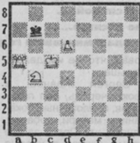
№ 2. Д. МАХАТАДЗЕ (Грузия)

Опровержения, чередуясь с ходами черных в ложных следах, составили варианты решения с правильными матами. Игра белых дополнена чередованием первых и вторых ходов.