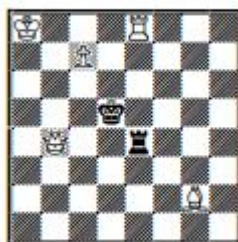
№ 13. А. Стёпочкин Россия Похвальный отзыв

s#9 b) ♖a5→c5 5+2 c) ♖a1→e4; d) ♖e1→f1; e) ♖a5→c6; f) ♖a5→e7