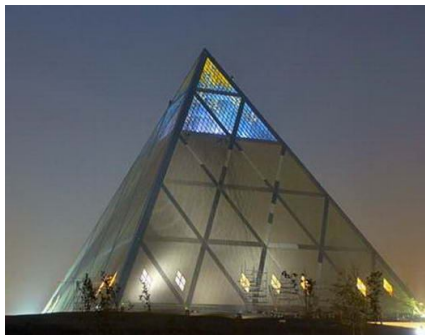
Астана. Дворец мира и согласия

Разговор о профессиях будет продолжен, но уже с шахматной конкретикой. Главный же вывод, как мне кажется, такой: сила духа, юмор и уверенность заложены в нас шахматной композицией. За неунывающих, за шахматных искателей!